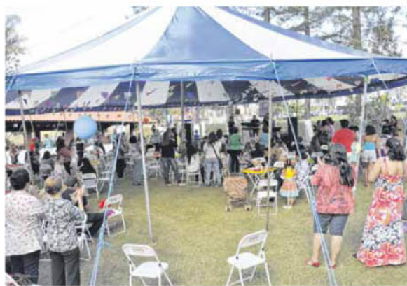
Passeata da Saúde, Festa Junina, homenagem a Arlindo e Jantar da Saúde

O Sindicato dos Trabalhadores da Saúde de Jaú e Região é dos mais atuantes e está sempre na mídia para prestar contas ao associado. Esta edição do jornal "O Fôrceps" traz o resumo dos últimos trabalhos desenvolvidos pela entidade. Veja nas páginas a seguir. Acompanhe! Participe!