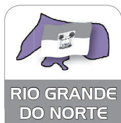
RIO GRANDE DO NORTE

Com renovação ínfima (12,50%), apenas um novato compõe a bancada potiguar. Dos oito membros, todos tentaram a reeleição e apenas um foi barrado nas urnas – Rogério Marinho (PSDB). Obtiveram êxito Betinho Rosado (DEM), 109.627; Fábio Faria (PMN), 156.688; Fátima Bezerra (PT), 220.355; Felipe Maia (DEM), 137.494; Henrique Eduardo Alves (PMDB), 191.110; João Maia (PR), 217.854; e Sandra Rosado (PSB), 92.746.